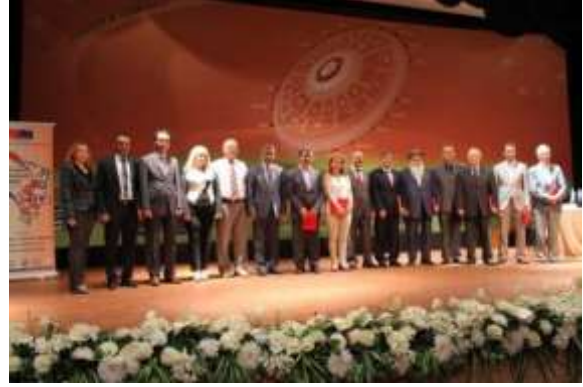
Çeşitliliğimiz Zenginliğimiz Sempozyumu